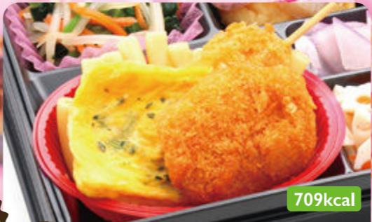
11 ヒレカツ & 串カツ 煮物盛り合わせ