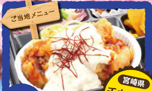
24 宮崎県チキン南蛮タルタル