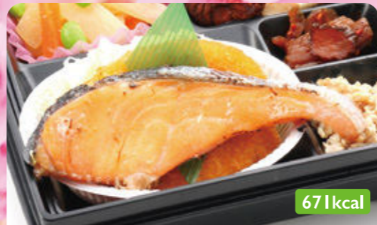
8 鶏唐揚げ 里芋煮/フレンチサラダ