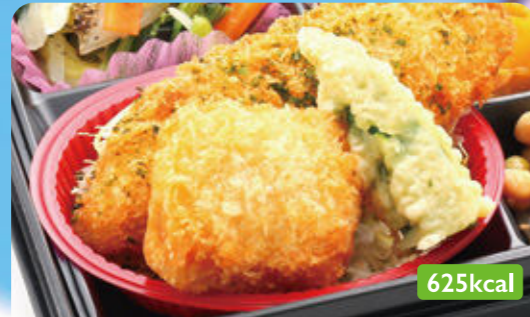
1 海鮮ミックスフライ弁当 白菜黒胡椒炒め/わらび煮