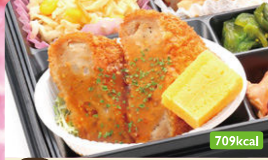
30 メンチカツ マスタードソース メンマピリ辛炒め/大根サラダ