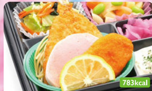
14 ハムカツ カレー/白菜甘酢和え