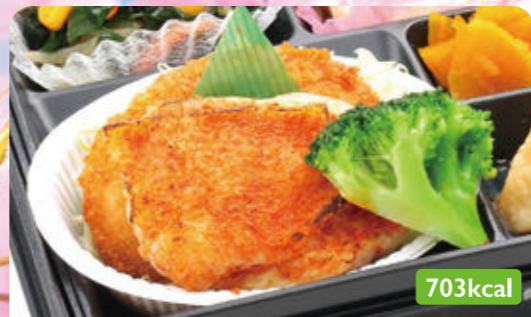
15 アジフライ キャベツピーナッツ和え/じゃがいも甘辛煮