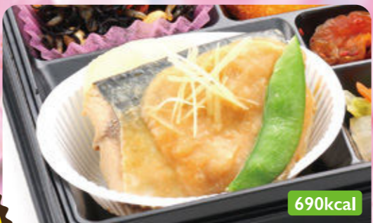
25 サバ味噌煮 ハムクラッチカツ/ひじき大豆煮