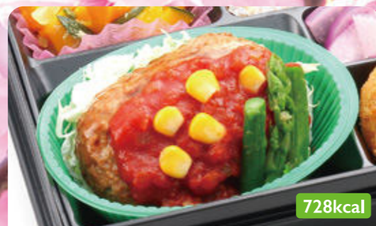
21 ササミフライ プロッコリーサラダ/れんこんソテー