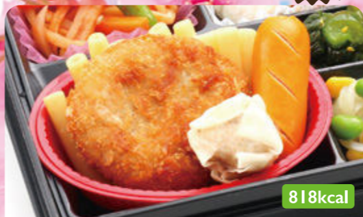
16 タンドリーチキン きのこ味噌煮/わかめ中華和え