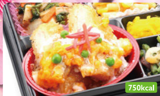
22 煮込みハンバーグ カニクリームコロッケ/かぼちゃツナサラダ