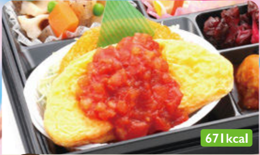
4 オムレツ トマトソース ハムサラダフライ/根菜煮