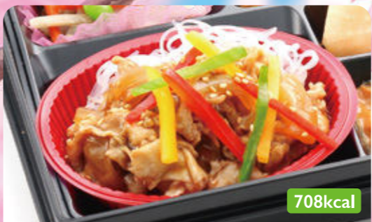
17 チーズメンチカツ 竹の子ピリ辛炒め/オニオンサラダ