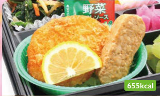
3 おろしチキンカツ フキ煮/青菜ごまみそ和え