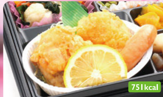
7 トンカツ オクラ梅肉和え/かぼちゃ甘煮