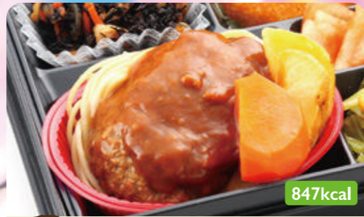
2 ハンバーグ デミソース もちもちフライ/サウザンサラダ